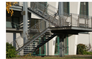
FLUCHTTREPPE MEHRZWECKHALLE, STAHLKONSTRUKTION, GITTERROSTSTUFEN, GELÄNDER MIT WELLGITTERRAHMEN-FÜLLUNG, FEUERVERZINKT.