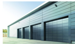
INDUSTRIE-SEKTIONALTOR GESCHLOSSEN ODER MIT SICHTFELDERN