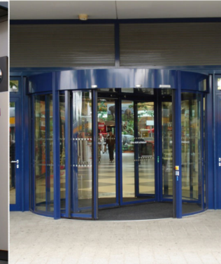
AUTOMATISCHE KARUSELLTÜR MIT SEITLICHEN FLUCHTAUSGÄNGEN IN EINE BESTANDSFASSADE INTEGRIERT