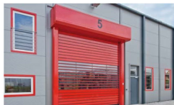
ROLLTOR-VORSATZELEMENTE MIT TRANSPARENTEN SICHTLAMELLEN