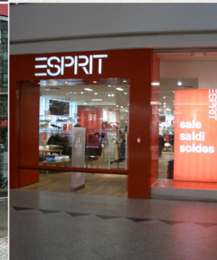
SHOPFASSADE GROßFLÄCHIG VERGLAST UND EINGANGSPORTAL MIT AUTOM. HUBSTAFFELTOR IN GANZGLASAUSFÜHRUNG