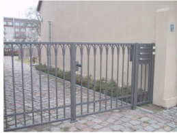
DREHFLÜGELTOR MIT SEITENTEIL