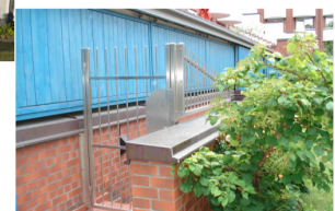
GITTERTÜR UND ÜBERSTEGSCHUTZ AUS EDELSTAHL NACH INDIVIDUELLEM ENTWURF