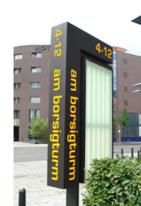
MIETERPYLON MIT HINTERLEUCHTETEM BESCHRIFTUNGSFELD, DECOUPIERTER UND HINTERLEUCHTETER SCHRIFTZUG