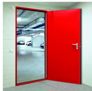
FEUERSCHUTZ-STAHLECHTÜREN IN T30 - T60 - T90 AUSFÜHRUNG EIN UND ZWEI FLÜGELIG OBERFLÄCHE VERZINKT U. GRUNDIERT AUCH IN EDELSTAHL