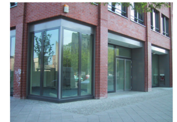
SCHAUFENSTER MIT 90° GLASECKSTOß