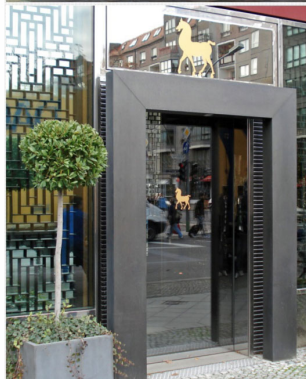
EINGANGSPORTAL EDELSTAHLVERKLEIDET MIT 1- FLÜGL. AUTOMATIKTÜR UND VERSPIEGELTER FÜLLUNG