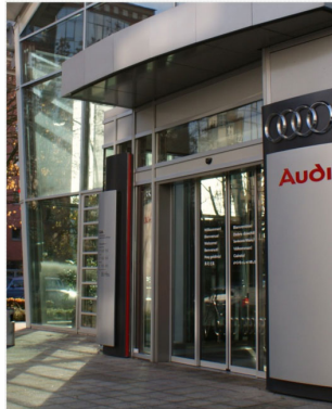
EINGANGSFASSADE MIT AUTOMATISCHER SCHIEBETÜR, ÜBERDACHUNG UND BLECHVERKLEIDUNG