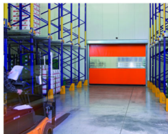
SCHNELLAUFTOR FÜR INDUSTRIE UND HANDEL