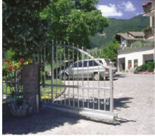
FREITRAGENDES SCHIEBETOR MITTELGURTFÜHRUNG