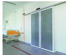
AUTOMATISCHE SCHIEBETÜR MIT TRANSPARENTER ODER GESCHLOSSENER TÜRFÜLLUNG